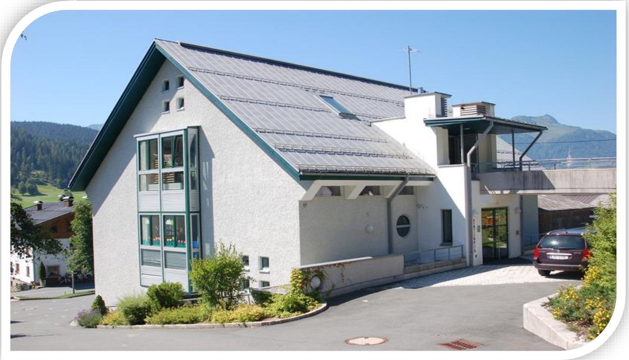
Kinderschutzkonzept Kindergarten der Gemeinde St. Jakob in Haus